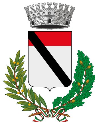
Comune di Challand-Saint-Victor