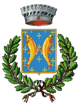
Comune di Bard