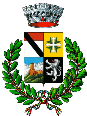
Comune di Brusson