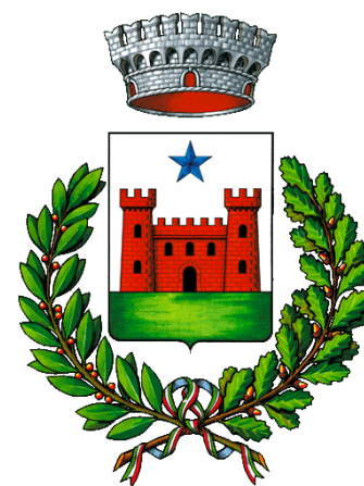
Comune di Châtillon