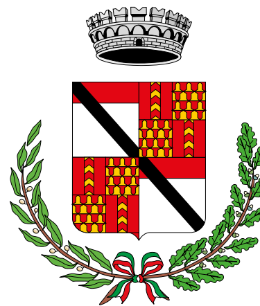
Comune di Verrès