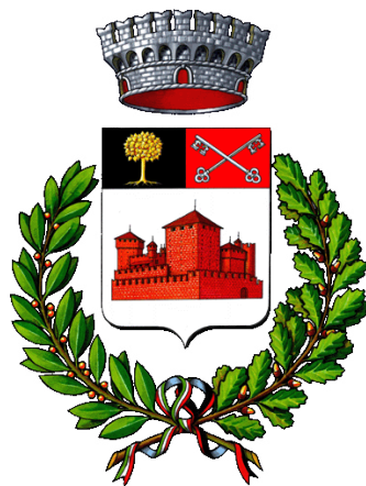
Comune di Fénis