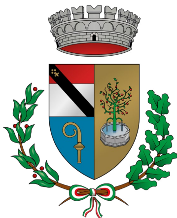
Comune di Issogne